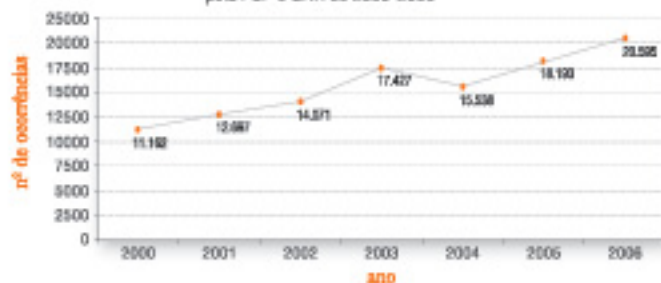
Gráfico 1 : Crimes relacionados com violência doméstica registados pela PSP e GNR de 2000-2006

Fonte: Ministério da Administração Interna